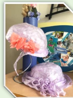
Création de chapeaux composés de film alimentaire