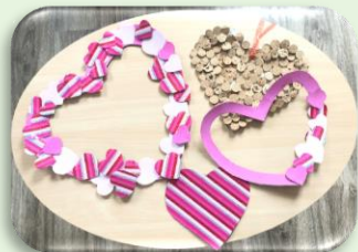
Décoration pour la Saint-Valentin

Les animations sont réalisées en fonction des souhaits et des intérêts de chacun.