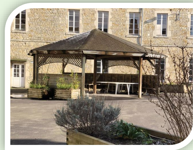
Pergola située au sein des extérieurs de l'accueil de jour